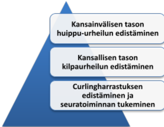
Kuva 1. Suomen Curlingliiton olemassaolon tarkoitus

Suomen Curlingliiton olemassaolon tarkoitus lajiliittona jakaantuu kolmeen osa-alueeseen, jotka on esitetty alla olevassa kuviossa.