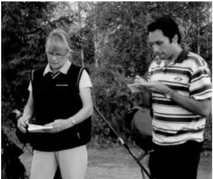
Tulosten merkitseminen on tarkkaa hommaa...